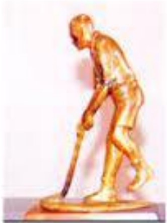
DHYAN CHAND AWARD